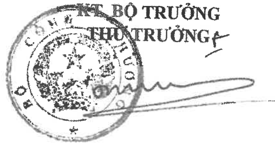
Đỗ Thắng Hải